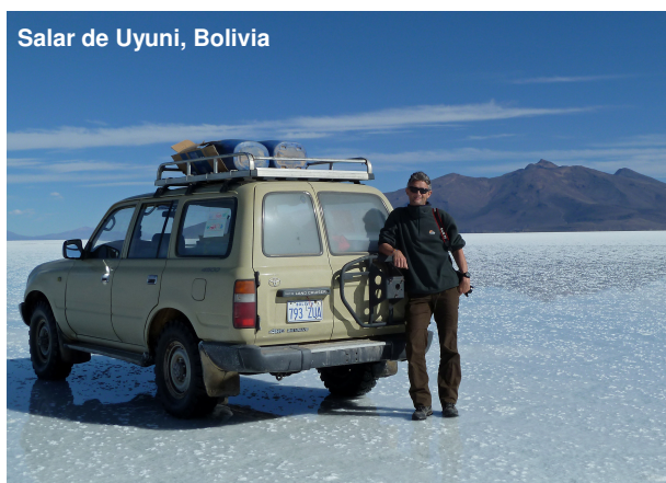
Salar de Uyuni, Bolivia